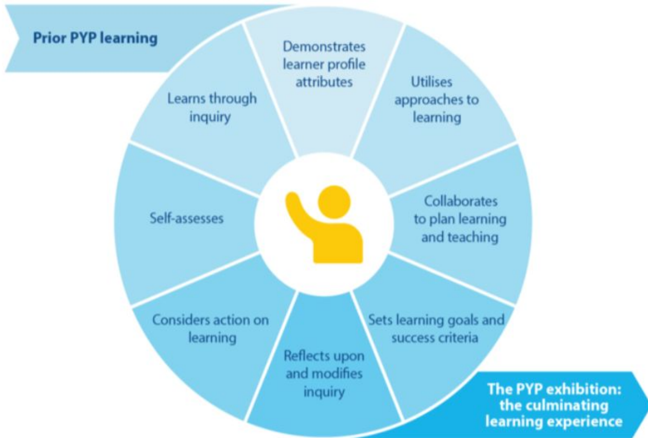
Figure EX01: The PYP exhibition